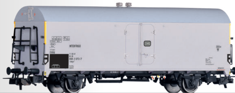
Kühlwagen Ichqrs 377 „INTERFRIGO“ der DB Refrigerator car Ichqrs 377 "INTERFRIGO" of the DB