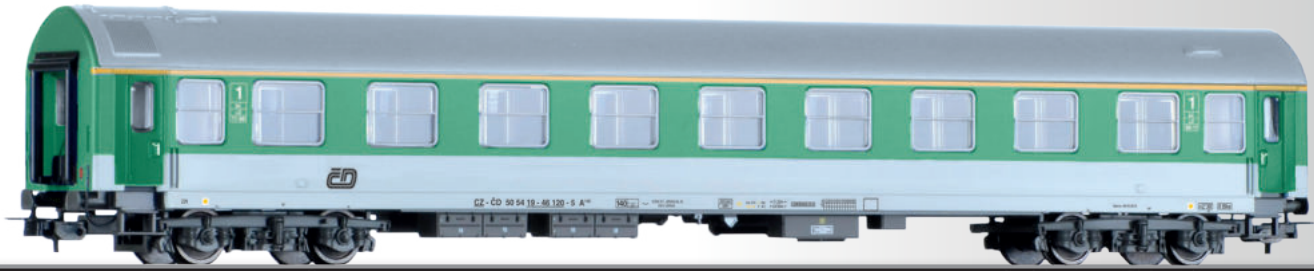
Reisezugwagen 1. Klasse A 150, Typ Y, der ČD 1st class passenger coach A 150, type Y, of the ČD