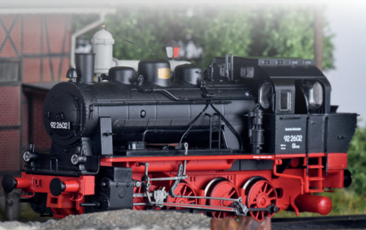
Abbildung zeigt: Art.-Nr.: 72012, Dampflokomotive 92 2602 der DRG, Ep. II