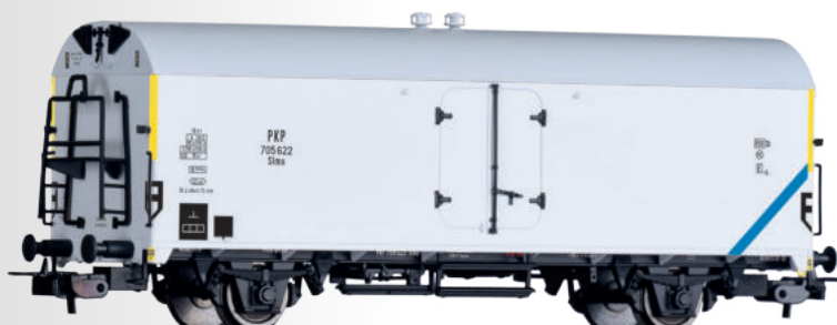
Kühlwagen Slms der PKP Refrigerator car Slms of the PKP