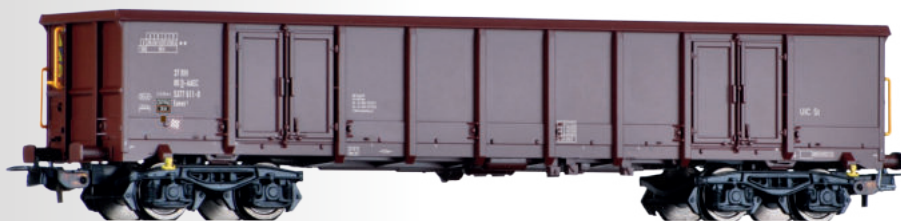
Offener Güterwagen Eanos der AAE Cargo Open car Eanos of the AAE Cargo