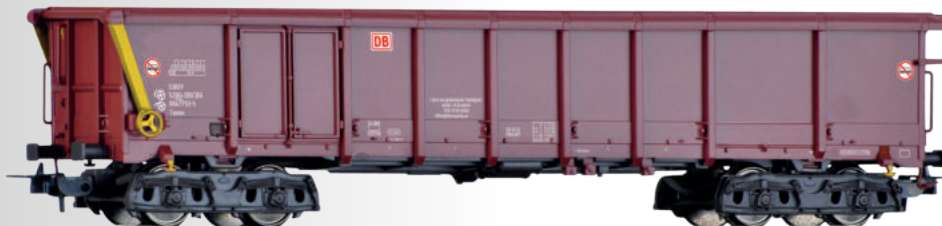
Rolldachwagen Taems der DB AG Sliding roof car Taems of the DB AG