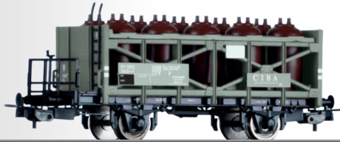
Säuretopfwagen „CIBA AG“, eingestellt bei den SBB Acid pot car „CIBA AG“ of the SBB