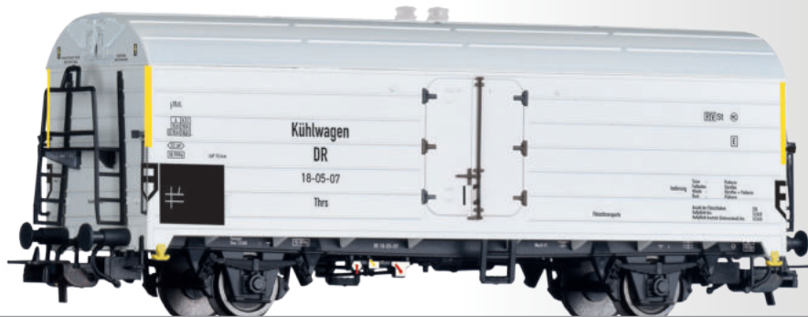
Kühlwagen Thrs der DR Refrigerator car Thrs of the DR