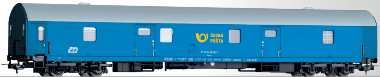
Bahnpostwagen der ČESKÁ POŠTA Mail wagon of the ČESKÁ POŠTA