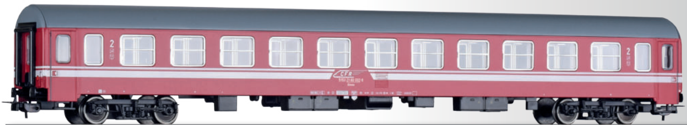
Reisezugwagen 2. Klasse Bmee, Bauart Bautzen, der CFR 2nd class passenger coach Bmee, type Bautzen, of the CFR