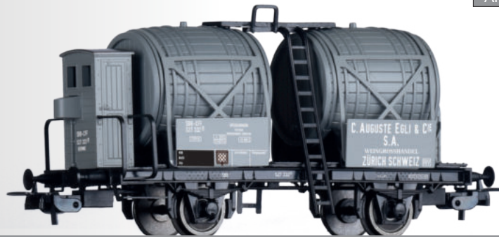
Weinfasswagen „C. Auguste Egli & Cie.“, eingestellt bei den SBB Wine barrel car „C. Auguste Egli & Cie.“ of the SBB