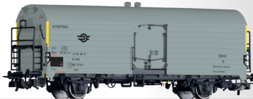
Güterwagenset „INTERFRIGO“ der DR, DB und MAV, bestehend aus drei Kühlwagen Freight car set "INTERFRIGO" of the DR, DB and MAV with three refrigerator cars