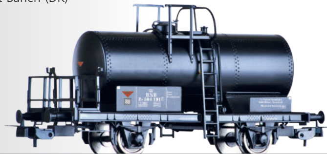
Kesselwagen ZE „A/S Luxol Kemiske Fabrikker“, eingestellt bei der DSB Tank car ZE „A/S Luxol Kemiske Fabrikker“ of the DSB