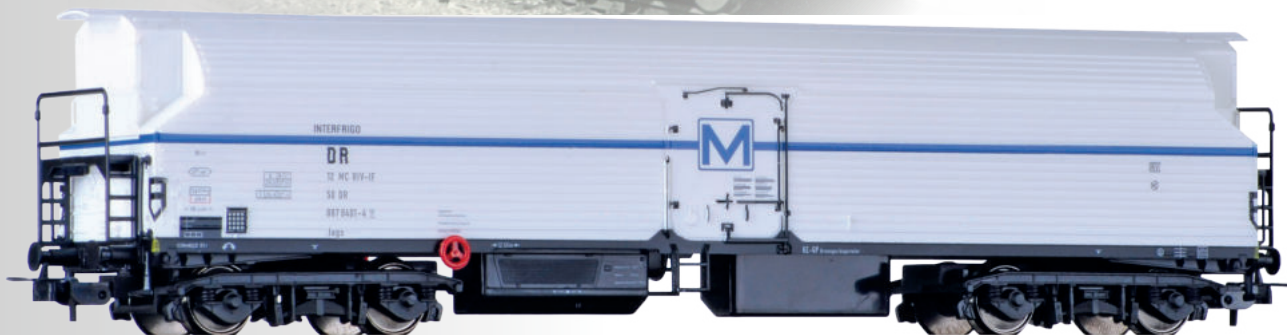
Maschinenkühlwagen „INTERFRIGO“ der DR Refrigerator car "INTERFRIGO" of the DR