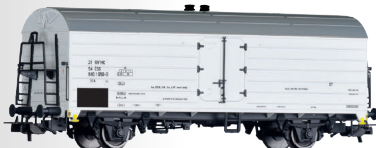
Kühlwagen Ics der ČSD Refrigerator car Ics of the ČSD