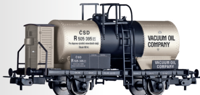
Kesselwagen „VACUUM OIL COMPANY“, eingestellt bei der ČSD Tank car „VACUUM OIL COMPANY“ of the ČSD