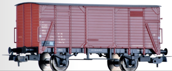
Gedeckter Güterwagen Gkml der DR Box car Gkml of the DR