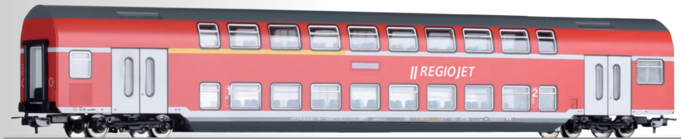
Doppelstockwagen 1./2. Klasse DABz755 der RegioJet 1st/2nd class double-deck coach DABz755 of the RegioJet