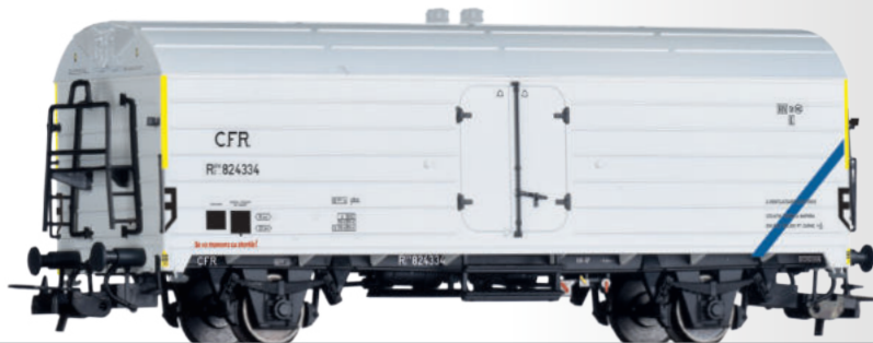
Kühlwagen Rsfw/c der CFR Refrigerator car Rsfw/c of the CFR