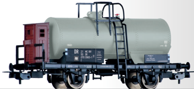
Kesselwagen Z der DR, vermietet an VEB Chemische Werke Buna Tank car Z "VEB Chemische Werke Buna" of the DR