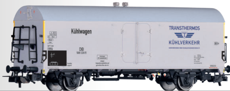
Kühlwagen „Transthermos Kühlverkehr“, eingestellt bei der DB Refrigerator car "Transthermos Kühlverkehr" of the DB