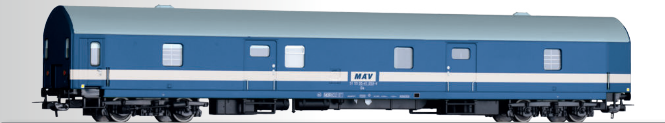
Gepäckwagen Da der MAV Baggage car Da of the MAV