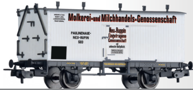
Kühlwagen der Molkerei- und Milchhandels-Genossenschaft Neu-Ruppin, eingestellt bei der Paulinenaue-Neuruppiner Eisenbahn (PNE) Refrigerator car of the Molkerei- und Milchhandels-Genossenschaft Neu-Ruppin, of the Paulinenaue-Neuruppiner Eisenbahn (PNE)