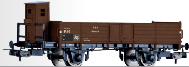
Offener Güterwagen PJ der Køge-Ringstet Banen (DK) Open car PJ der Køge-Ringstet Banen (DK)