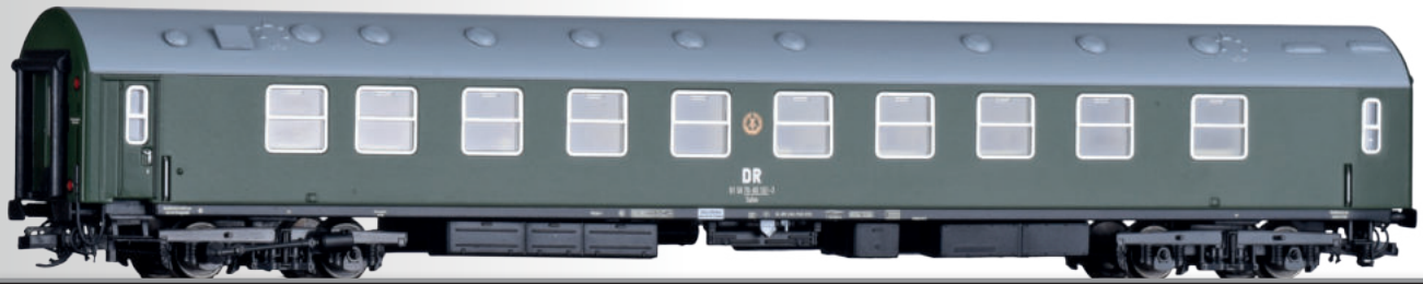
Abbildung zeigt TT-Modell

FORMNEUHEIT: Salon-Nachrichtenwagen der DR