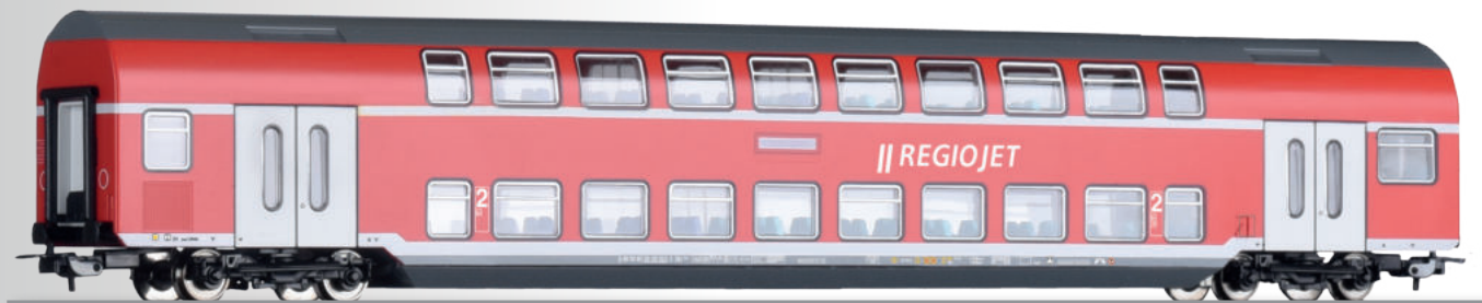
Doppelstockwagen 2. Klasse DBz750 der RegioJet 2nd class double-deck coach DBz750 der RegioJet