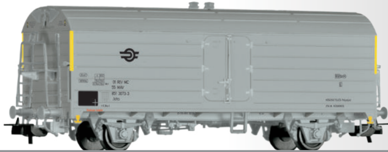
Kühlwagen Ichs der MAV Refrigerator car Ichs of the MAV