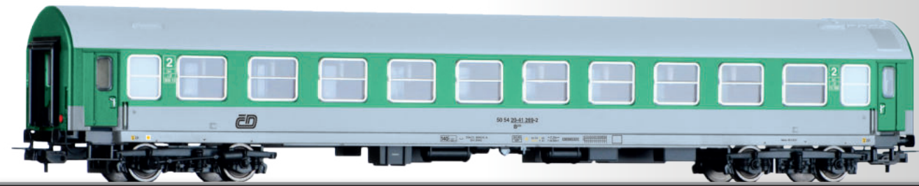
Reisezugwagen 2. Klasse B 250, Typ Y, der ČD 2nd class passenger coach B 250, type Y, of the ČD