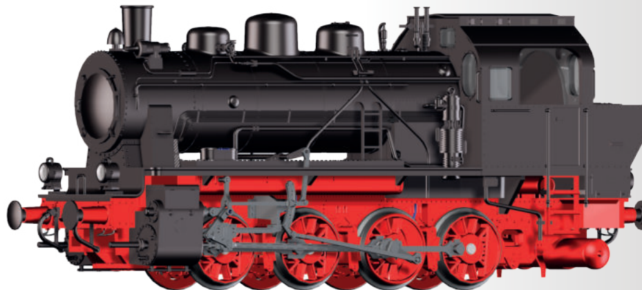
Dampflokomotive Nr. 4 der Hersfelder Kreisbahn Steam locomotive No. 4 of the Hersfelder Kreisbahn

Please note: All the following models are unique editions, last date of order: 31st march 2021